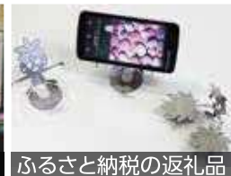
ふるさと納税の返礼品